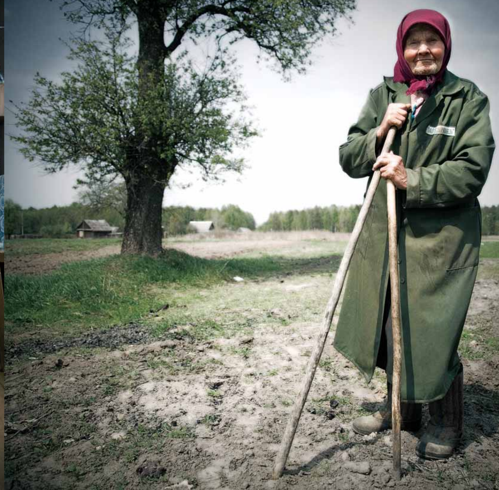
Nei pressi delle zone chiuse, gli abitanti hanno continuato a vivere di quello che offre la terra. Sopra, un'anziana signora nella sua casa. Nella pagina a fianco, una contadina posa nel campo. Chernobyl, 2006