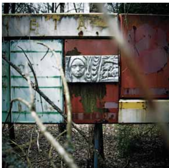
A destra, l'interno di una casa in una delle zone chiuse in seguito al disastro. Sopra e sotto, il paesaggio circostante. La contaminazione provocata dall'incidente nucleare non interessò solo le aree prossime alla centrale, ma si diffuse irregolarmente, secondo le condizioni atmosferiche, interessando soprattutto aree di Bielorussia, Ucraina e Russia. Chernobyl, 2006