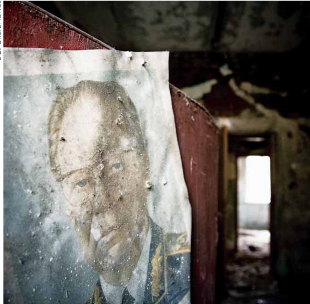
A sinistra, il pavimento di una casa in una delle zone chiuse in seguito al disastro. Sopra e sotto, l'interno di una "casa del popolo" abbandonata nella stessa zona. Dalla notte del 27 aprile fino al settembre del 1986, furono evacuati dalla zona di esclusione un totale di 116 mila abitanti. Negli anni successivi, altre 220 mila persone vennero trasferite altrove. Chernobyl, 2006