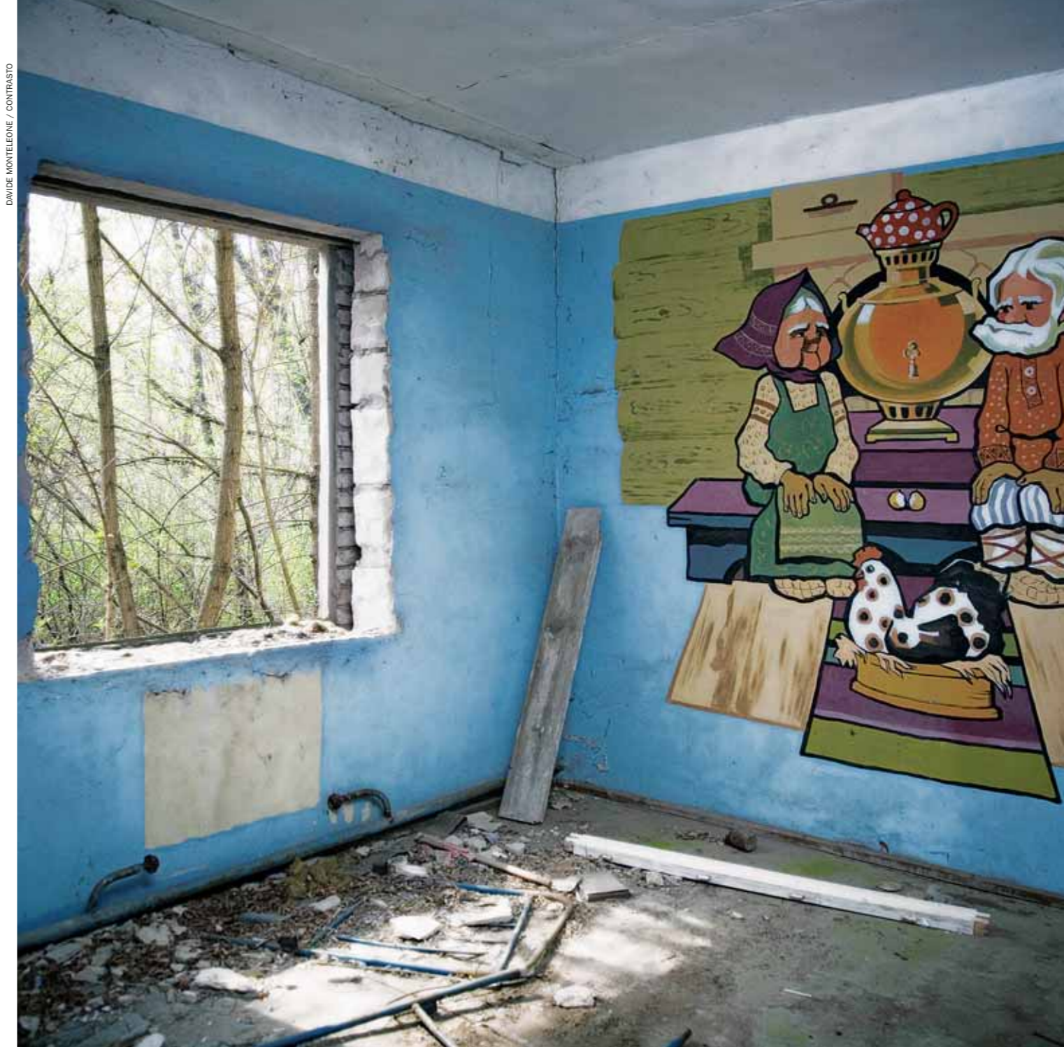
Interno di una scuola in una delle zone chiuse in seguito al disastro. Nella popolazione che all'epoca della sciagura aveva un'età tra 0 e 18 anni sono stati registrati quattromila casi di tumore della tiroide, direttamente imputabili all'esposizione allo iodio 131. Chernobyl, 2006

Nel 2002 si trasferisce a Mosca. Da questa esperienza nasce il progetto che segna la sua crescita professionale e il suo modo di fotografare. Nel 2005 comincia a collaborare con L'Accademia di Francia a Roma per cui svolge attività di documentazione della Villa Medici. Non dimentica l'attualità internazionale e nel 2007 vince il World Press Photo con le immagini di Beirut. Nel novembre del 2007 pubblica il volume "Dusha-Anima Russa" che raccoglie i 5 anni di lavoro svolti nelle repubbliche dell'ex unione sovietica. È membro dello staff di Contrasto dal 2001.